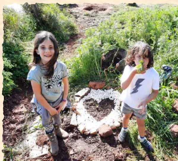
Amor na horta Love in the garden

In our garden, as in life, there is a lot of diversity, and like children, plant growth needs a sublime combination of the elements of heaven and those of earth.