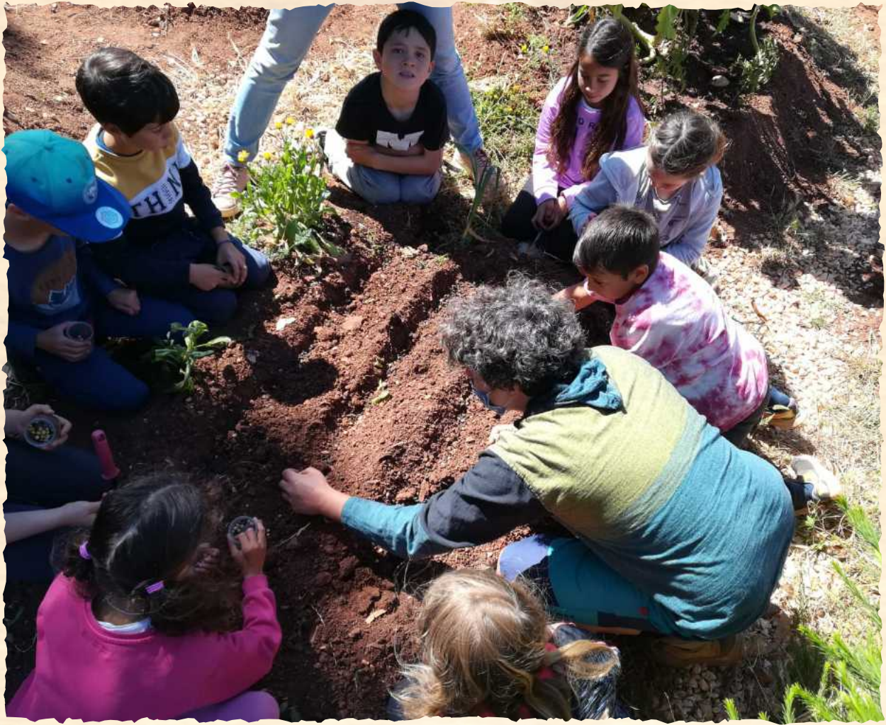
Aprender na horta Learn in the garden

As crianças puseram as mãos na terra e de uma forma simples e prática puderam perceber como os diversos elementos naturais interagem para gerarem a vida de uma forma harmoniosa e respeitadora do meio ambiente. Puderam ainda descortinar como o engenho humano e a sabedoria acumulada de milhares de anos de cultivo no nosso planeta, permitem-nos actualmente dispor de ferramentas e técnicas ajustadas que maximizam a sustentabilidade destas práticas.